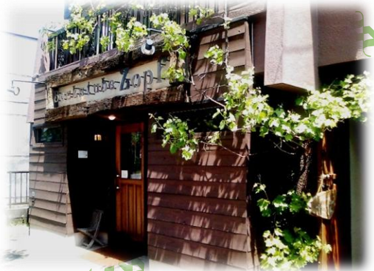
ZOPF 前 (当日) 普段は右に人がはみ出して並んでいる。

この特異状況により、わが軍は、久しぶりのパンを補給する事が出来た。補給品の一部を報告する。