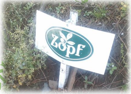
駐車場のマーク (このマークのここだけ)

尚、“ZOPF”は、インターネットで通販・事前予約可能。また、2Fにパンを主体にしたレストランもある。ただし、予約は必須である。