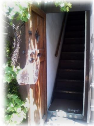
ZOPF レストラン入り口 くわしくは、 http://www.zopf.jp/index.html

なに! 久しぶりにパンの補給を行うように上級士官様より命令が、われわれに下ったのであった。