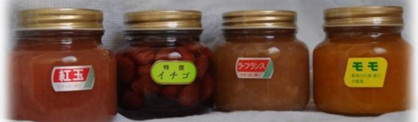
紅玉の裏：よく見ると果肉が見えるかも